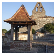
Mairie de Boudou

Les Visites Guidées Estivales : "LE LUNDI A BOUDOU, BOUDOU A 360° DU PANORAMA AU PATRIMOINE"