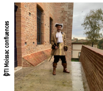
PTI Moissac confluences

Les visites guidées hors-saison: "VISITE THEATRALISEE, TOUR DE SAINT-NICOLAS AVEC LE CADILLAC, SUR LES PAS DE L'ILLUSTRE GOUVERNEUR"